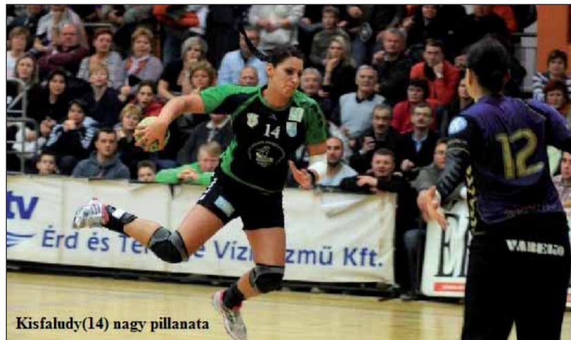
Kisfaludy(14) nagy pillanata

Igazán imponáló januári statisztikai mutatóval, és önbizalomtól duzzadva várhattuk a bajnokság 16. fordulójában a Siófok elleni hazai összecsapást. Jó előjelként felhozható volt a mérkőzés előtt, hogy az év első találkozóján a Vác is nagyot bukott Érden, mint aktuális 3. helyezett.