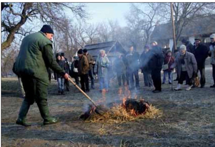
A malacot hagyományosan, szalmával pörzsölték