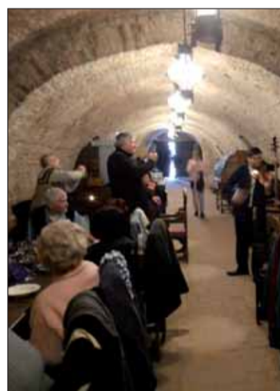
A pincében volt a disznótör