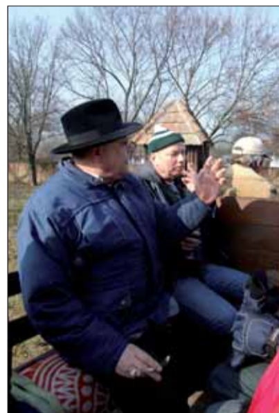
Lovaskocsikázás is volt a programban